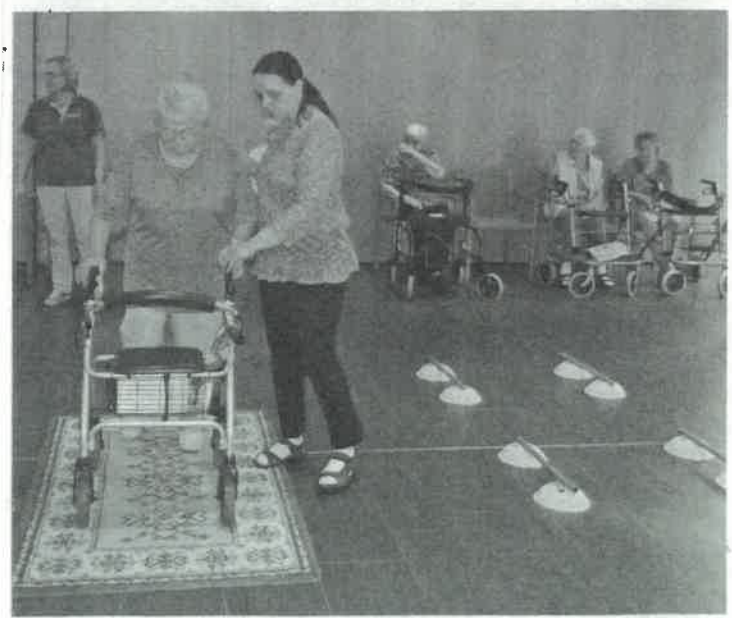
Mitarbeiterin aus dem Bereich „Betreuung“ des Pflegeheimes Erlenbad beim Begehen des Trainingsparcours mit einer Heimbewohnerin

Vielmehr wog jedoch bei allen Beteiligten die Tatsache, dass die Senioren mit sichtbarer Freude und großem Eifer an dieser außergewöhnlichen Veranstaltung im Pflegeheim Erlenbad teilnahmen. Martin Meier